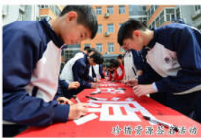
珍惜青春励志活动